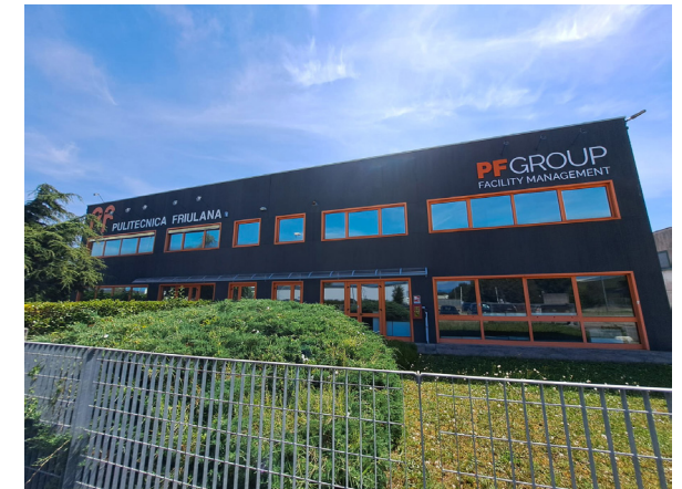
SEDE DI UDINE