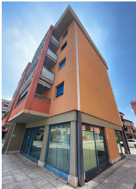
SEDE DI MILANO